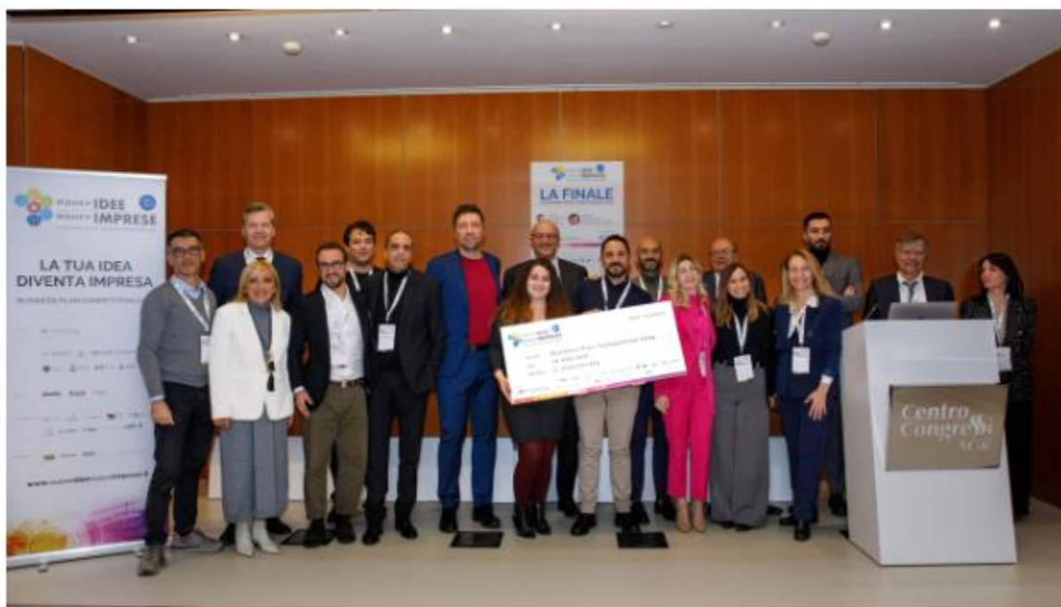
La premiazione del concorso

Al secondo posto Medici Umani, un progetto di un team di Bologna dedicato in particolare ai giovani medici per aiutarli nei momenti di difficoltà anche psicologica