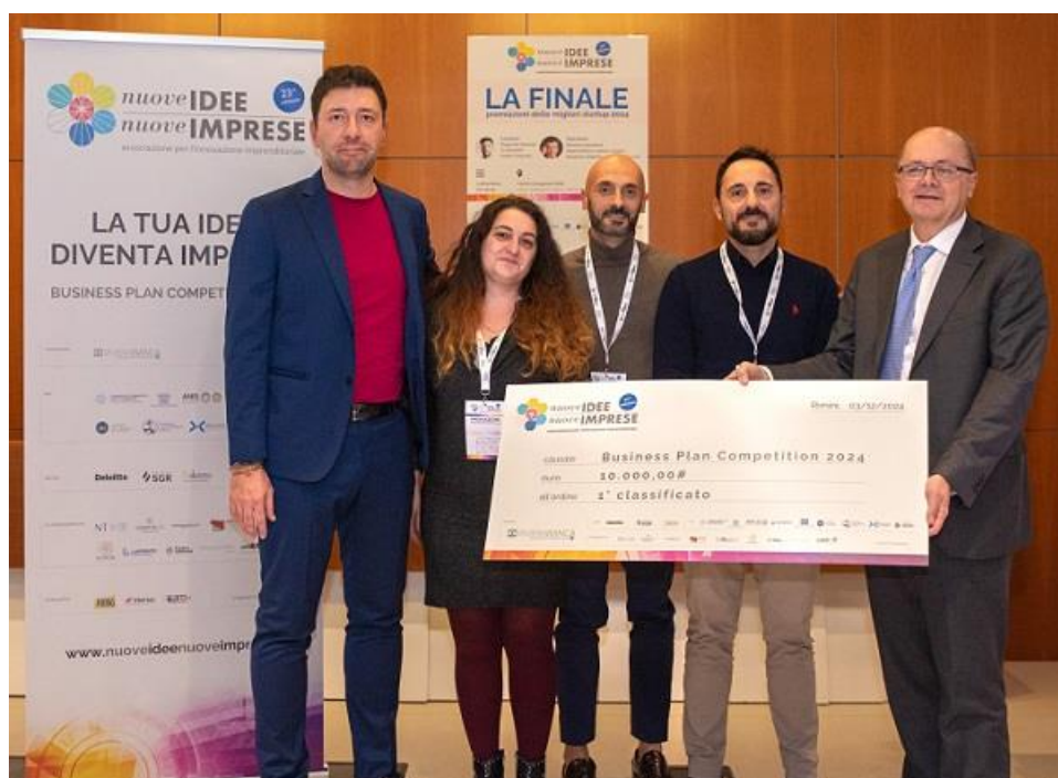
NUOVE IDEE E NUOVE IMPRESE – LA FINALE – premiazioni delle migliori startup Rimini (Centro SGR) 3 dicembre 2024 – Nella photo un momento della giornata finale

Ai primi tre classificati un montepremi di 19.000 euro , con 10.000 euro al progetto classificatori primo. Si aggiungono i premi "in kind" messi in palio dai soci e dai partner di Nuove Idee Nuove Imprese: percorsi di incubazione, assistenza amministrativa, consulenze e numerose altre agevolazioni.