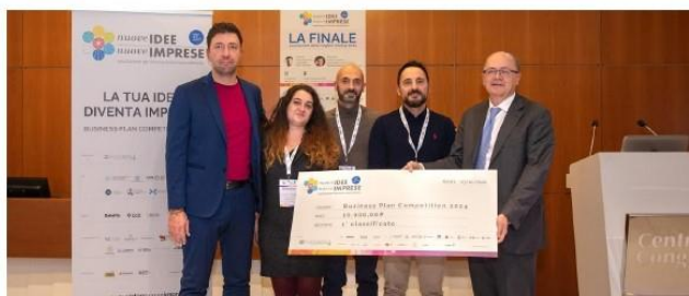
La premiazione della start up ravennate Ludotechnic

Primo posto e 10mila euro per i progetti presentati da Ludotechnic Terzo premio per Myvet