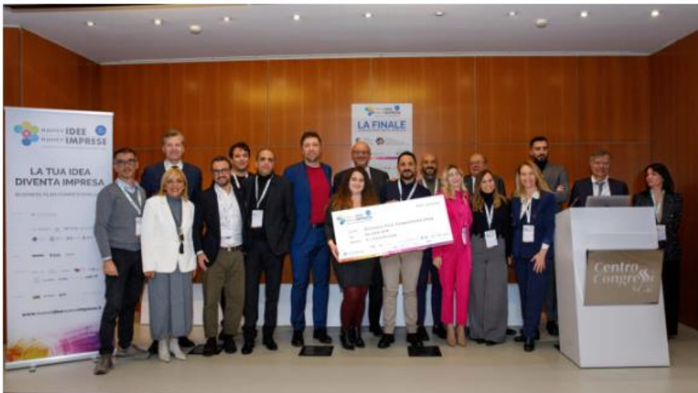
Le aziende premiata a Rimini per "Nuove idee nuove imprese"

Al secondo posto Medici Umani, un progetto di un team di Bologna dedicato in particolare ai giovani medici per aiutarli nei momenti di difficoltà anche psicologica